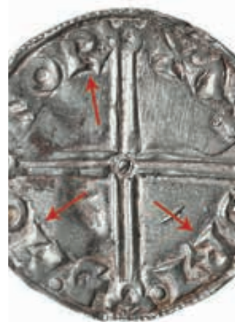
Figur 5. Utsnitt av Asthriith sin Cnut mynt (fig. 1) hvor punselskaden er illustrert med pil.